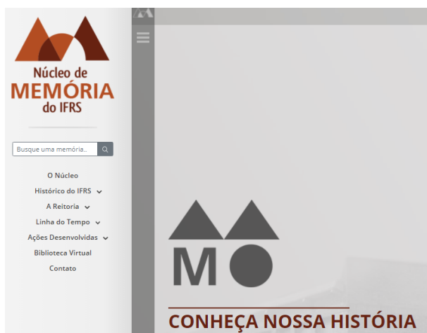
Foto 2. Capa do site do Núcleo de Memória do IFRS.

Neste mesmo ano, no dia 26 de julho, foi lançado o site do NuMem , canal com o objetivo de divulgar e preservar a história do IFRS e das instituições que deram origem ao instituto.