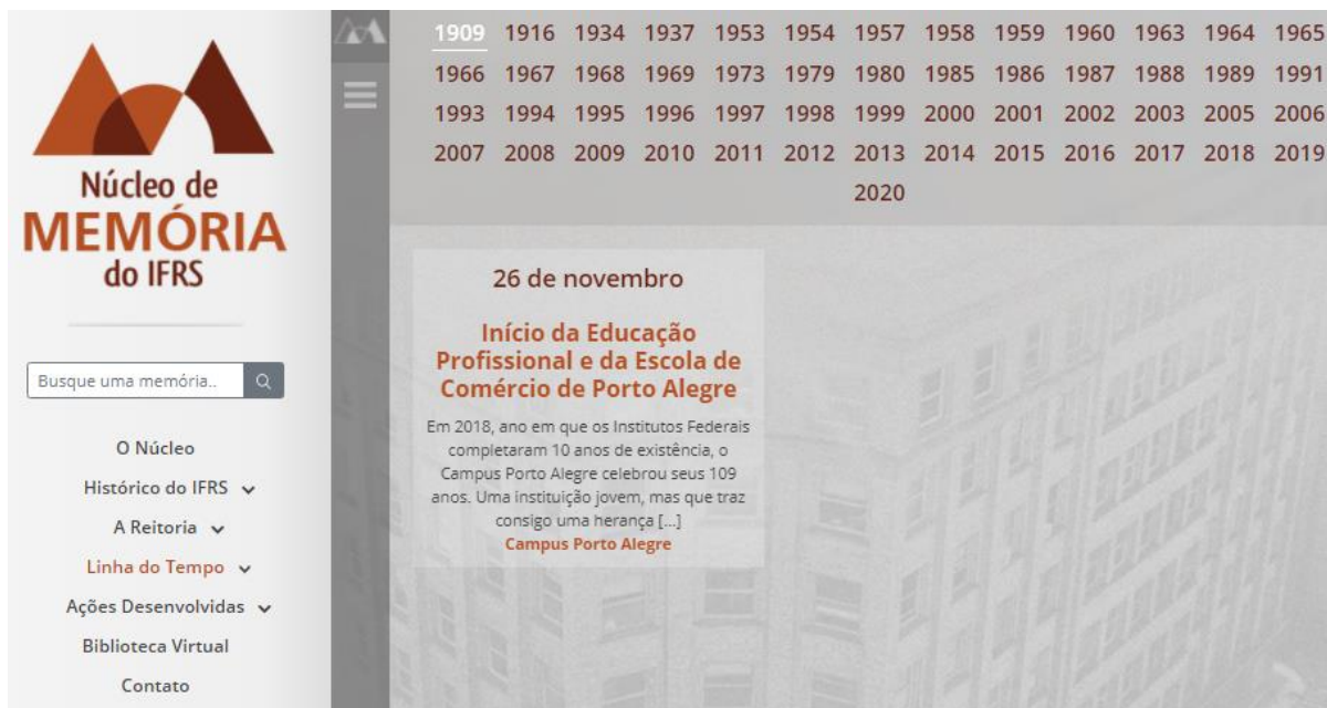
Foto 3. Linha do Tempo no site do NuMem/IFRS.

Os representantes dos campi colaboraram com o envio de fotos e informações para abastecer a Linha do Tempo que conta hoje com dados distribuídos ao longo dos 53 anos indicados, iniciando em 1909 com a fundação da Escola de Comércio de Porto Alegre e encerrando em 2020. A Linha do Tempo do site está em constante atualização em função de informações levantadas em pesquisas históricas e de dados produzidos agora, que já fazem parte da memória da instituição.