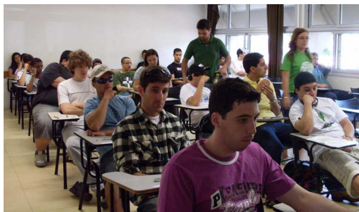
Candidatos aguardam o início das provas.

No total, os cursos subsequentes tiveram 91 candidatos ausentes de 623 inscritos, o que corresponde a 14,6% de abstenção. Já os números dos cursos integrados surpreenderam: dos 609 inscritos, apenas 19 candidatos não compareceram às provas, 3,1% de abstenção. Para o diretor do Campus Rio Grande, Osvaldo Casares Pinto, a expressiva participação dos candidatos aos cursos integrados demonstra comprometimento dos estudantes e interesse em ingressar na Instituição. Os primeiros candidatos começaram a sair às 10h dos locais de prova. O gabarito foi divulgado às 14h no site da escola.