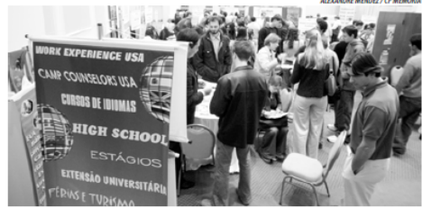
Feira internacional, aberta ao público, reúne informes e contatos sobre estudos e trabalho

Os professores da Uergs podem ser contratados pelo Sinpro, por serem representados com base na CLT. A categoria aprovou a negociação da manutenção do pagamento, até maio, dos 15 vale-remetido, cada um de R$ 13,00, enquanto não forem recuperadas perdas salariais.