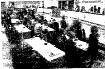
Plenário da CMPA em atividade