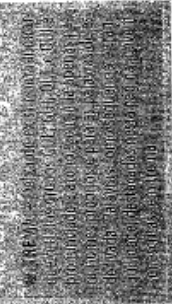
Secretários de Educação de todas as cidades das regiões metropolitanas com mais de 100 mil habitantes têm prazo até 15/2 para informar se aceitam participar do "Mais Educação". No programa, escolas de Ensino Fundamental recebem apoio técnico e financeiro do MEC para oferecer atividades no contraturno das aulas. Com recursos da ordem de R$ 70 milhões, a previsão é atender às escolas de 116 municípios dos 26 estados e do DF.