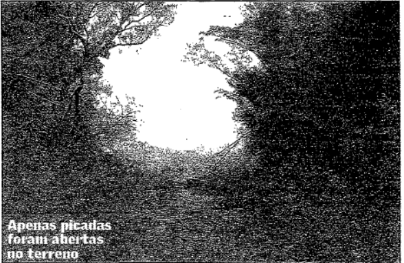
Apenas picadas foram abertas no terreno

Como o terreno de cerca de 7,2 hectares está coberto pelo mato — parte dele é área de preservação ambiental —, com apenas duas picadas abertas, o futuro diretor não está otimista. De acordo com Eliezer Pacheco, secretário de Educação Profissional e Tecnológica do Mec, Educação e Saúde foram poupadas dos cortes do governo em função da crise mas, para o segundo semestre, o quadro poderá ser modificado: — Como vamos justificar um recurso de R$ 5,5 milhões parado? Hoje, envolvidos na construção da escola estarão reunidos com a Comissão de Educação da Câmara de Vereadores.