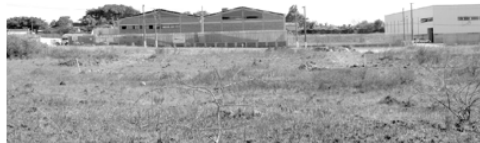
Comissão Pró-Escola Técnica Federal busca agilização das obras na área municipal já doada na Capital

■ O Programa Educativo da Fundação Iberê Camargo promoverá capacitação gratuita de professores, por ocasião da exposição "Jorge Guinle - Belo Caos", que será aberta ao público na quarta-feira (10), com 33 pinturas e 20 desenhos do artista carioca. A mostra tem curadoria de Ronaldo Brito e Vanda Klabin, que participaram da capacitação no dia 10. Haverá turmas nos dias 10, 11 e 13/9, à tarde. Vagas limitadas. Inscrições: (51) 3247-8013.