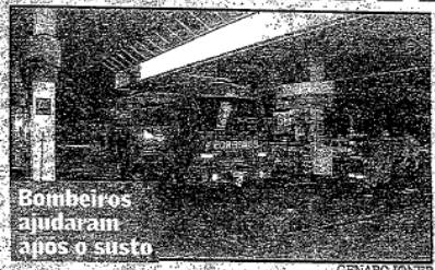
Bombeiros ajudaram após o susto

da avenida, ajudaram a impedir que as chamas se propagassem. Dois funcionários foram intoxicados pela inalação de gás e um terceiro sofreu queimaduras leves. Nenhum deles está em situação grave.