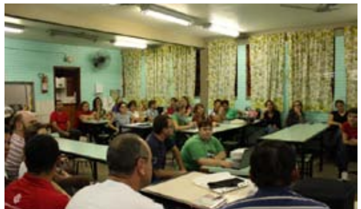
Reunião do NAPNE