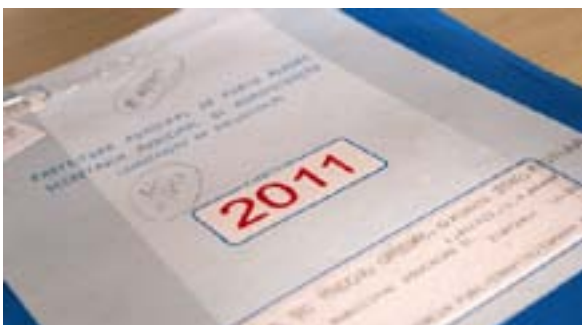
Projeto da quadra de esportes