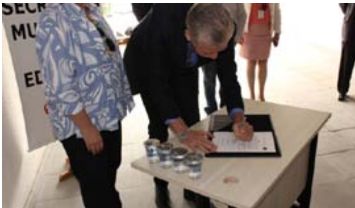
Prefeito autoriza construção da quadra