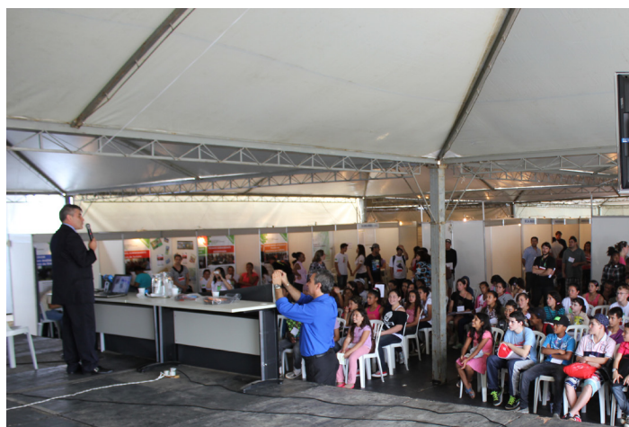
Programação da Mostra incluiu palestras técnicas