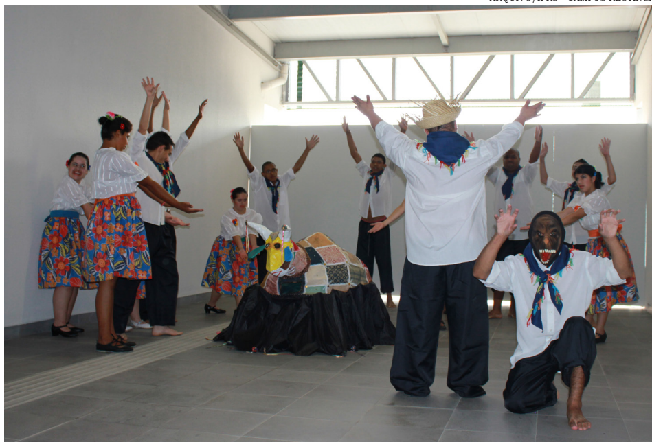
Grupo da Escola Tristão Sucupira apresentou danças folclóricas no Câmpus

Os Núcleos de Atendimento às Pessoas com Necessidades Educacionais Específicas e de Estudos Afro-brasileiros e Indígenas (NAPNE e NEABI) realizaram o Seminário de Educação e Diversidade junto com a Rede de Atendimento à criança e ao adolescente da Restinga. Na temática das deficiências o evento contou com a presença de Rotechild Prestes, presidente da COMDEPA, e Jovane Guissone, atleta paralímpico medalha de ouro nos Jogos de Londres, em Esgrima. Também foram abordadas questões sobre educação indígena e a temática afrodescendente. A