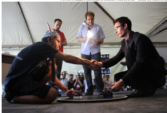
Robôs são montados e programados pelos estudantes

D urante a Mostra, ocorreu a I Competição Brasileira de Robótica Educacional - I COBRE, reunindo participantes dos institutos federais do Rio Grande do Sul (IFRS), Sul-Riograndense (IFSul), Goiano (IFG) e Baiano (IFBaiano). O campeonato foi uma iniciativa do Robocet, projeto da Secretaria de Educação Profissional e Tecnológica (Setec) do Ministério da Educação (MEC), que visa a utilização da robótica no ensino. Numa disputa acirrada, o campeão geral foi a Equipe Farrapos, do IFSul. O Câmpus Restinga foi representado pela Equipe Berserkers.