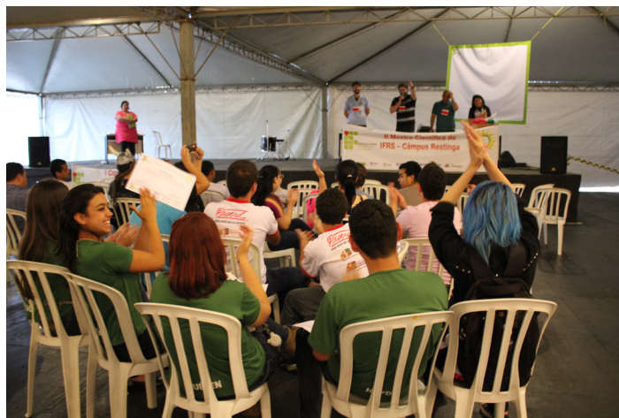
Mostra encerrou com premiação dos melhores trabalhos