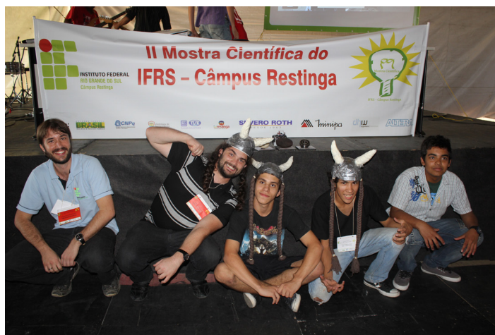
Equipe Berserkers foi premiada em três categorias