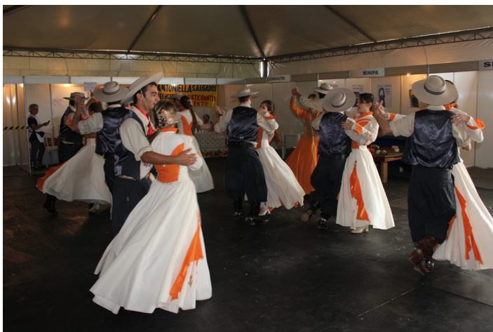
Apresentações culturais conquistaram o público