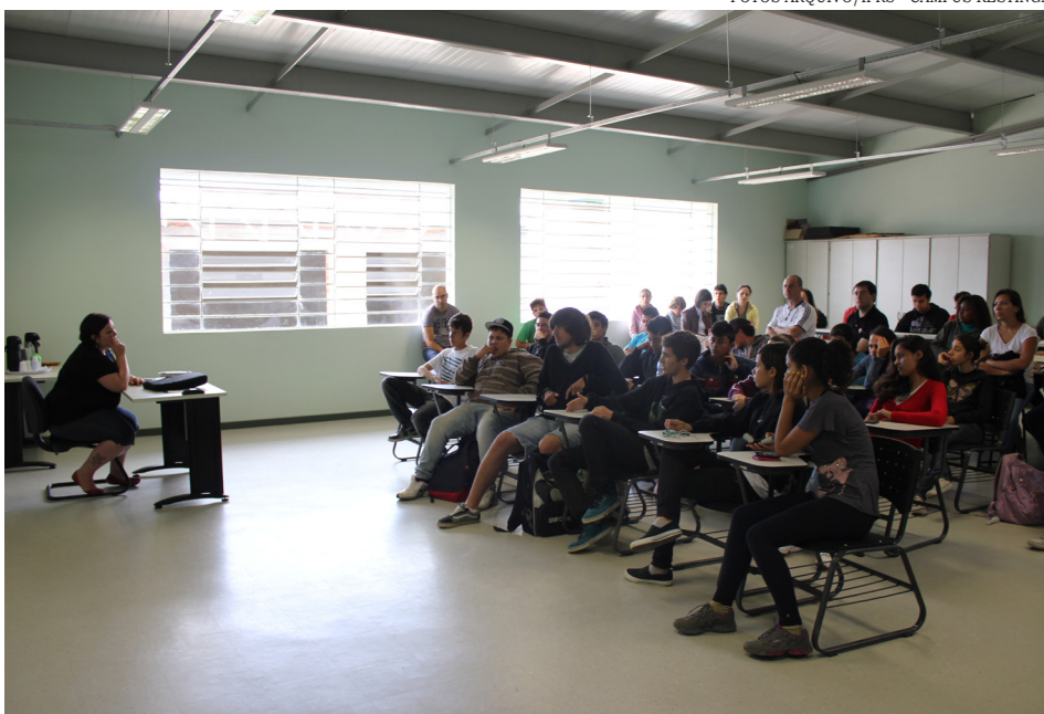
Três assembleias foram realizadas para debater principais temas do Câmpus

afirmativas. Todas elas tiveram encaminhamentos que deverão servir de diretrizes aos novos gestores sobre as demandas dos alunos e servidores do câmpus.