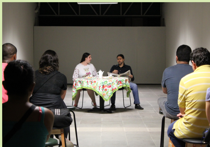
Apresentação do Grupo Fênix encerrou o evento

O Câmpus Restinga promoveu, nos dias 29 e 30 de outubro, a Jornada Acadêmica 2012. Diversas atividades movimentaram a instituição, como palestras, minicursos e oficinas nas áreas de Informática, Administração e Turismo. Os estudantes tiveram a oportunidade de visitar a Exposição sobre Alan Turing, no Museu da UFRGS. Também foi realizado um minicurso de degustação de vinhos e espumantes, pela Vinícola Peterlongo. O encerramento do evento contou com apresentação teatral do Grupo Fênix, do Câmpus Bento Gonçalves.