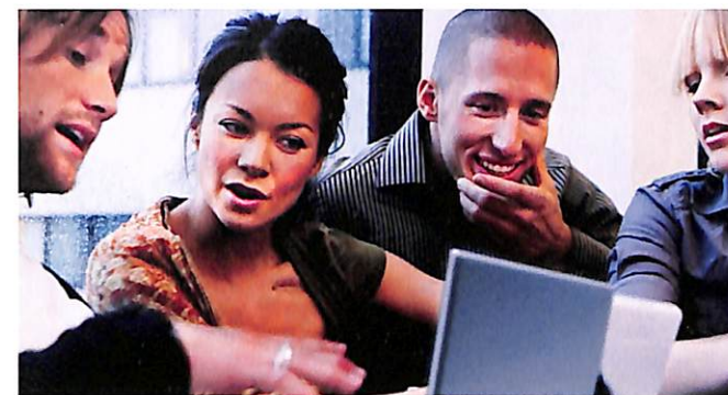
Foto: Mikael Dubois/Johnér, Ola Ericson/imagebank, sweden.se, Mikael Risedal/Lunds Universitet, Håkan Hjort/Johnér. 2013.

O Instituto Sueco (SI) é uma entidade pública destinada a fomentar o interesse pela Suécia e a confiança neste país, em todo o mundo. O SI procura estabelecer relações de cooperação duradouras com outros países, adotando uma política de comunicação estratégica e de intercâmbio nas áreas da cultura, da educação, das ciências e dos negócios.