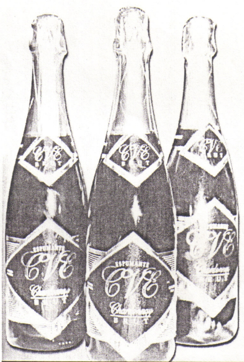
O novo Espumante CVE, Chardonnay Brut