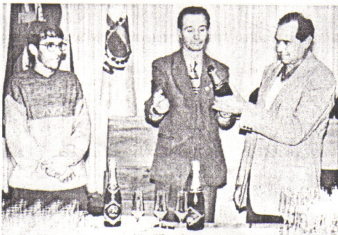
Primeiro Espumante CVE a ser aberto