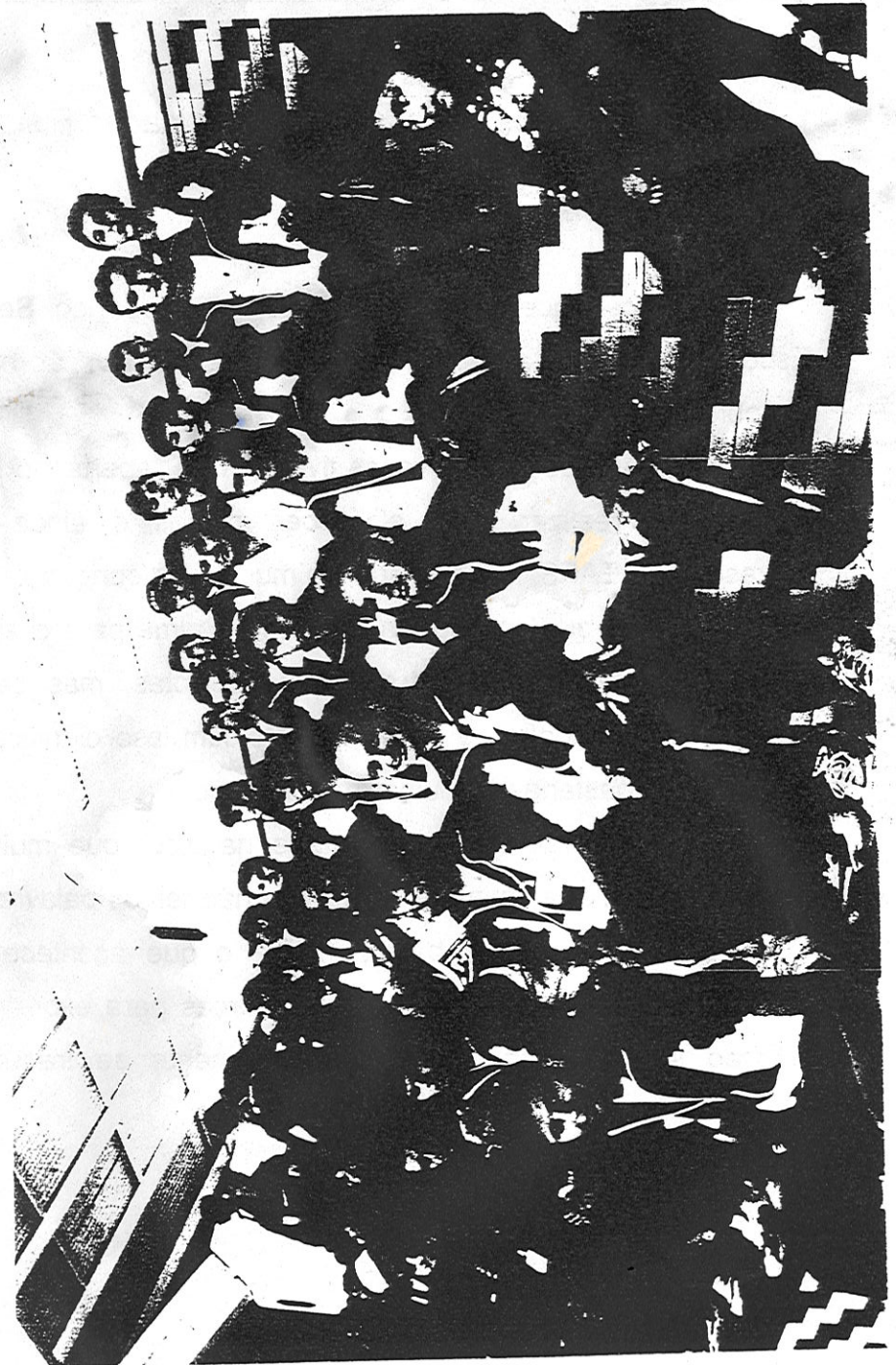
EAFS no V EDET em Rio Grande